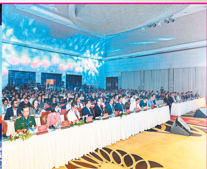
Lãnh đạo các ban, bộ, ngành Trung ương, đại diện lãnh đạo một số tỉnh thành trong khu vực và các đại biểu tham dự buổi lễ.