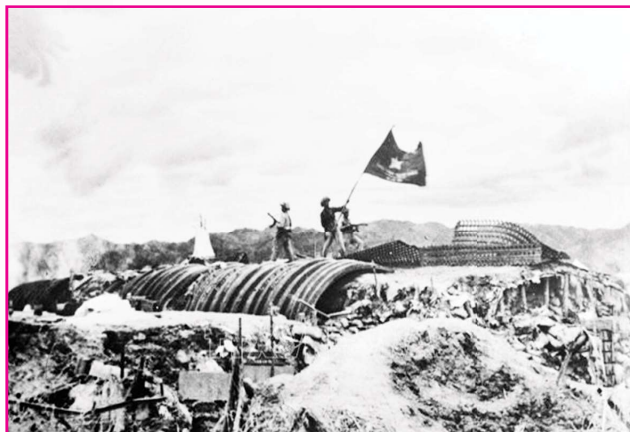
Chiều ngày 07/5/1954, lá cờ "Quyết chiến - Quyết thắng" của Quân đội nhân dân Việt Nam hiên ngang tung bay trên nóc hầm tướng De Castries. Chiến dịch lịch sử Điện Biên Phủ đã toàn thắng.

Đảng bộ, chính quyền và đồng bào các dân tộc Điện Biên đang tập trung kiện toàn hệ thống chính trị, tăng cường thu hút đầu tư, khai