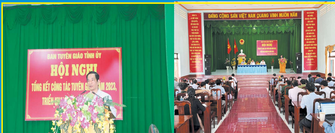
Hội nghị tổng kết tuyến giáo năm 2023, triển khai nhiệm vụ năm 2024.