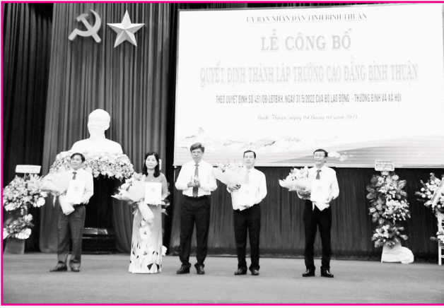
Lễ công bố Quyết định thành lập Trường Cao đẳng Bình Thuận trên cơ sở sáp nhập trường Cao đẳng Cộng đồng Bình Thuận, Trường Cao đẳng Y tế Bình Thuận, Trường Cao đẳng Nghề Bình Thuận.

giảm 23 phòng thuộc chi cục, tổ chức tương đương.