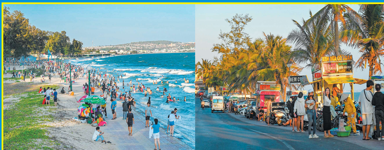
Du lịch Bình Thuận đón 180.000 lượt khách trong dịp Tết Giáp Thìn.