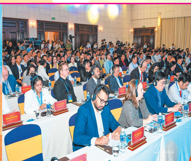
Nhà đầu tư quốc tế tham dự tại buổi lễ