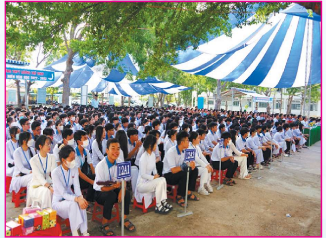
Các buổi triển lãm số "Hoàng Sa, Trường Sa của Việt Nam - Những bằng chứng lịch sử và pháp lý" và tuyên truyền về chủ quyền biển, đảo được đông đảo cán bộ, giáo viên, học sinh tham gia.

Cùng với đó, cán bộ, giáo viên và học sinh của 2 trường còn được báo cáo viên Bộ Chỉ huy BDBP tỉnh Bình Thuận giới thiệu khát quát về tình hình biển Đông; vai trò, tầm quan trọng, các tiềm năng và lợi thế của biển, đảo Việt Nam trong phát triển kinh tế và bảo vệ Tổ quốc; các thông tin, bằng chứng lịch sử, pháp lý về chủ quyền biển, đảo Việt Nam đối