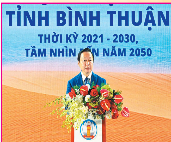
Phó Thủ tướng Chính phủ Trần Hồng Hà phát biểu chỉ đạo

Sáng 28/02, UBND tỉnh Bình Thuận long trọng tổ chức Lễ công bố Quy hoạch tỉnh Bình Thuận thời kỳ 2021 - 2030, tầm nhìn đến năm 2050. Sự kiện có ý nghĩa đặc biệt đưa Bình Thuận đến gần hơn với nhà đầu tư trong và ngoài nước để cùng nhau biến các tiềm năng, thế mạnh, mục tiêu, ý tưởng của tỉnh thành hiện thực, giúp Bình Thuận phát triển nhanh và bền vững trong thời gian tới. Phó Thủ tướng Chính phủ Trần Hồng Hà, lãnh đạo các ban, bộ, ngành Trung ương, đại diện lãnh đạo một số tỉnh thành trong khu vực tham dự.