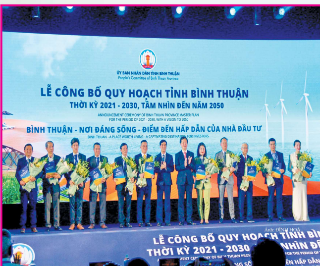
Lãnh đạo tỉnh trao quyết định chấp thuận chủ trương đầu tư, Giấy chứng nhận đăng ký đầu tư và trao bản ghi nhận đăng ký đầu tư.