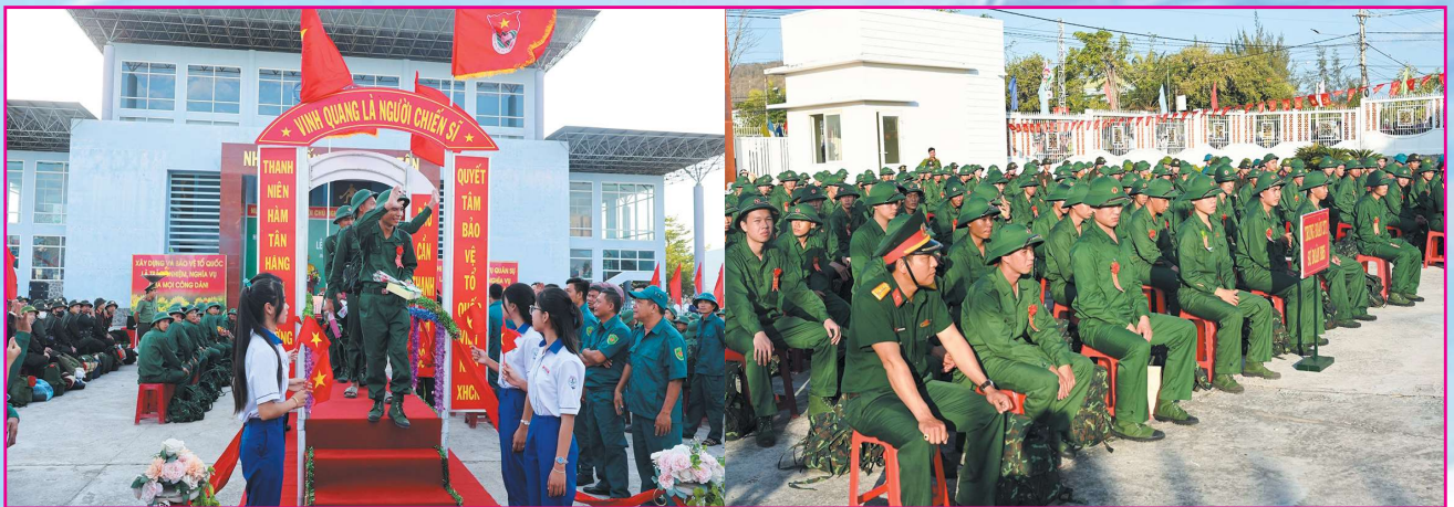
Các tân binh huyện Hàm Tân và huyện Hàm Thuận Nam lên đường thực hiện nghĩa vụ với Tổ quốc.

Kết quả giao quân năm 2024, tỉnh Bình Thuận giao, nhận 1.751 thanh niên, đạt 100% chỉ tiêu, trong đó 1.403 công dân nhập ngũ và 348 công dân thực hiện nghĩa vụ tham gia Công an nhân dân. Đặc biệt, trong số các tân binh có 29 đảng viên (đạt 2,07%, tăng 0,15% so với năm trước), 624 công dân viết đơn tình nguyện nhập ngũ (đạt 44,5%, tăng 0,31% so với năm trước), có 3 nữ (Phan Thiết 01, Bắc Bình 01 và Tánh Linh 01).