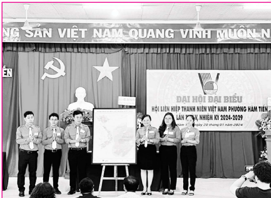
Đại diện Thành đoàn Phan Thiết trao tặng bản đồ Việt Nam tại Đại hội Hội LHTN Việt Nam phường Hàm Tiến, lần thứ V, nhiệm kỳ 2024-2029.

30/4/2025) và 80 năm Cách mạng Tháng Tám thành công, Quốc khánh nước Cộng hòa XHCN Việt Nam. Theo đó, cuộc vận động được phát động từ nay đến năm 2025 với quy mô rộng khắp trên toàn quốc, ở tất cả các cấp bộ Đoàn, Hội, Đội trong và ngoài nước thông qua việc treo bản đồ Việt Nam tại các không gian học tập, làm việc, sinh hoạt cộng đồng của thanh thiếu nhi và người dân Việt Nam. Bên cạnh đó, Trung ương Đoàn xây dựng bản đồ số 3D áp dụng công nghệ thực tế tăng cường để đoàn viên, thanh niên chụp ảnh với bản đồ kèm theo thông điệp của cuộc vận động nhằm lan tỏa, chia sẻ rộng rãi trên các nền tảng mạng xã hội.